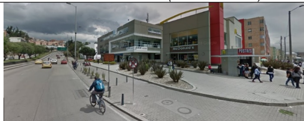
Foto No.4: Vista panorámica del inmueble de la Calle 139 No. 89 – 22 (dirección catastral), donde se encontraba instalado el elemento.