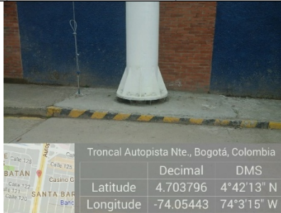
Foto No.3: Vista de la base de la valla tubular en buenas condiciones de mantenimiento y pintura, instalada en la Carrera 46 No. 152 – 46 (dirección catastral).